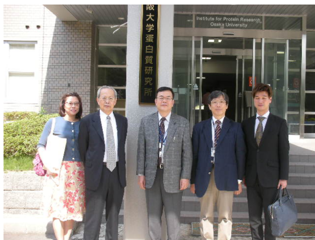
③副大臣一行との記念撮影